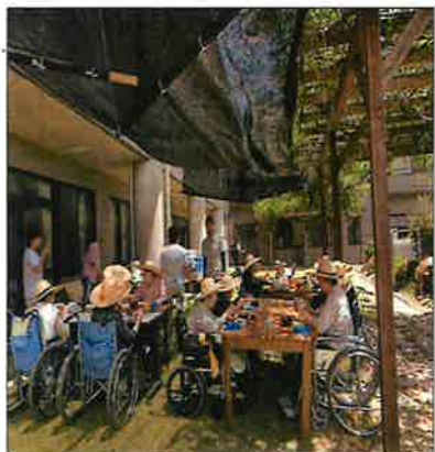
中庭に出て、五平餅、焼き鳥などをほうばりました。