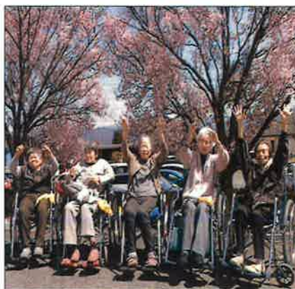
桜の前で、ハイ！ポーズ