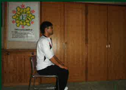
まずは背中を伸ばして椅子に座ります

第1回目は肩こり予防体操を紹介したいと思います。一番身近な痛みの肩こりは誰しものが経験していると思います。予防体操を行って健康に、元気に過ごしましょう！