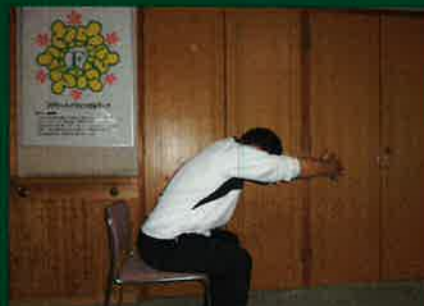
手を前で組んでそのまま前に押し出します