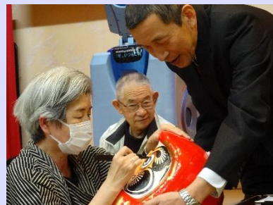
皆さんどんな一年だったのでしょうか?年男、年女によるだるまの目入れを終えたら、大いに盛り上がりました。