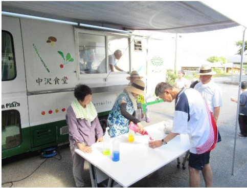
今年度のかき氷の様子です