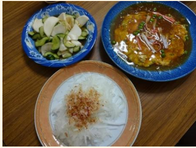
調理実習で作ったお昼ご飯です☆