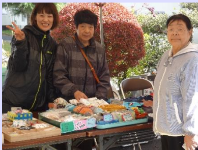
今年も3施設合同の文化祭『ほほえみ祭』が実施されました。利用者さん手作りの作品もたくさん売れましたね。