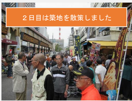
2日目は築地を散策しました