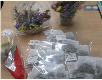
ハーブ・ドライフラワー作り、販売

チャレンジプログラムは毎月2回実施しています。プログラム内容はグループで行えるもの、個人で行うものなどさまざまで、利用者一人ひとりにあったものになるよう工夫し提供しております。主には一覧のとおりとなります。プログラム内容はまだまだ開発していく予定です。