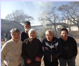
順天寮の新年最初の行事です!! 無病息災を願い、今年もいいスタートが切れるようにはりきっていきましょう~(O)~