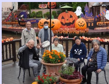
河口湖へ日帰り旅行に行ってきました。河口湖にあるオルゴール館はハロウィン一色。楽しめましたね♪