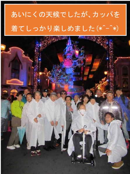
あいにくの天候でしたが、カッパを着てしっかり楽しめました(*^-^*)

宿泊はオリエンタルホテル東京ベイ。ふかふかのベッドで熟睡し、朝はバイキングでお腹いっぱいにご飯を食べることが皆さん大変満足されていました。東京タワーでは、展望台からの東京の景色を楽しみました。お昼は移転直前の築地でお寿司を食べ歩きをしてお土産もたくさん買うことができました。終わってみればとても楽しい旅行でした。