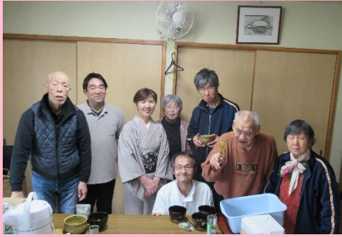
お茶の先生を囲んで!(^^)!

順天寮には利用者の皆さんで作る自治会(すずらん会)があります。利用者の皆さんの意見や要望を取りまとめたり、施設の取り組みに積極的に関わるなど、役員さんを中心に様々な場面で活躍していただいています。 今回も、利用者の活き活きと生活している姿を紹介するため、自治会役員の皆さんが、『お楽しみクラブ お茶を楽しむ会』について取材してくださいました。