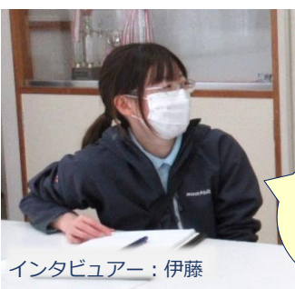
インタビューー：伊藤