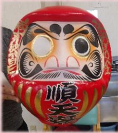
新年恒例 だるまの目入れ

令和7年がスタートし、1月16日に寮内で新年会を行いました。 運動不足になりがちなのこの季節、ゲームで身体を動かしたり、昔なつかしいお正月の遊びを楽しみました。 利用者の皆さんの和やかな笑顔と笑い声がいっぱいのひとときとなりました。