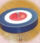
昔なつかし コマ回し