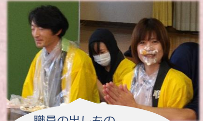
職員の出しもの 二人羽織は大盛りがり 大笑い!