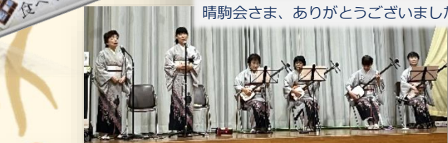
晴駒会さま、ありがとうございました _(_)_