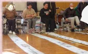
ランニングマン 足で新聞紙ロール をたぐり寄せます