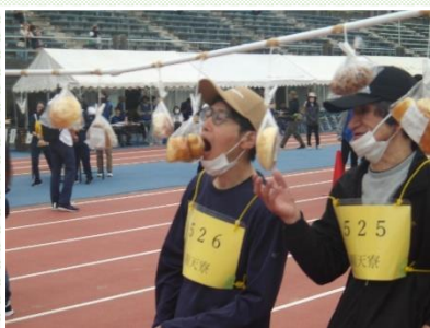
5月24日 上伊那障がい者 スポーツ大会