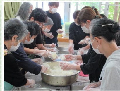
みんな総出でまるめました