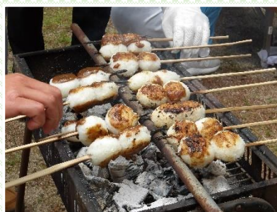
香ばしい? 五平もちができました