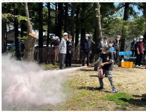
4月24日 春の防災訓練