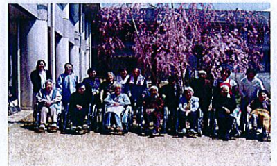
みんなで、ハイチーズ！！

晴天に恵まれ、花も見頃を迎えお花見会を行いました。1階食堂にて、ジュースで乾杯、鉄火ちらしに舌鼓を打つと自慢の喉を披露してくださる方や、信濃の国の大合唱と盛り上がりました。中庭よりシダレザクラを抜け満開に咲いた玄関前のソメイヨシノ、タカトウコヒガンザクラを觀賞しました。普段2階で生活されているご利用者の皆様には、シダレザクラをみる機会がなかった為「こんな綺麗な桜があったのね。」と、とても喜んでいただけました。