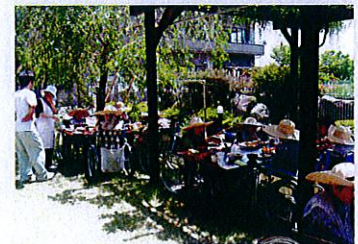
みなさん何本五平餅食べたかな？

6/6～6/10の5日間五平餅会を行いました。梅雨の時期でしたが天気の良い日が多く、中庭で五平餅を食べる事ができました。参加されましたご利用者の皆様、3、4本とおかわりをされていて、お腹いっぱいだと笑顔で話されていました。