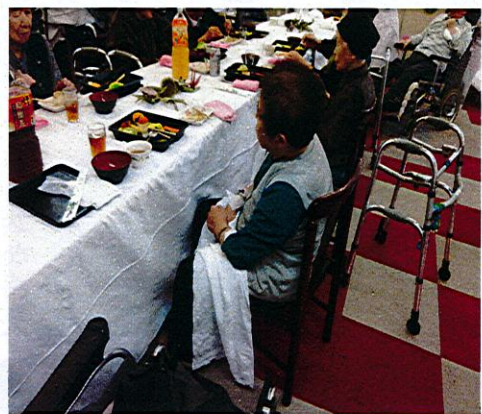
9月10日～12日の3日間に、デイケアの敬老会を行いました。喜寿の方が1名、傘寿の方が3名、卒寿の方が4名いらっしゃり、ささやかながら賞状を渡しお祝いさせていただきました。

利用者の皆さんは、最後まで夏祭りを楽しまれ、儂くも愉快なひと夏の思い出を脳裏に刻み込まれていたのです。