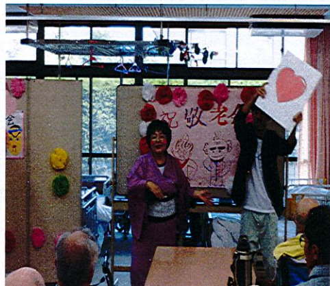
違う利用者の方とお会いして、笑顔にはどの方も同じ温かさを感じます。こんな皆様の喜ばせてあげたい、何とかしてあげたいと思ひ、係を中心に職員一同考えに考え、「三百六十五歩のマーチ」と「松の木小唄」の曲に合わせて踊りおりました。そして、「良かったよ」という言葉をお聞きいただき、嬉しく思いました。ただ一つ、利用される全員の方に参加していただけたのが申し訳なく思っています。

どの方も、他の人に優しく、それぞれの状況を理解して接してください、また来所されてから帰られるまでの時間を人と話をされたり、リハビリに取り組みながら過ごされています。逆に私たち職員の間も、利用者様の話を楽しませていただいております。毎日残りました。 デイケアを利用される方は、それからの状況も、利用されるお一人おひとりが元気になり笑顔が増えるようなデイケアサービスが出来るよう、職員一同力を合わせて努力してまいります。