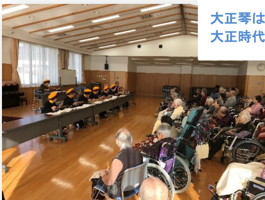
大正琴はその名の通り大正時代に生まれました。