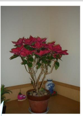
しゃくなげユニット