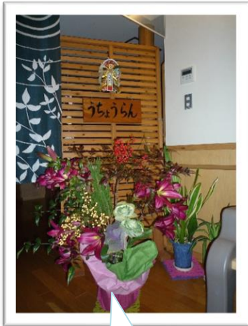
うちょうらんユニット